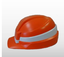
折畳みヘルメット 価格:4,720円(税込)

小型軽量で持ち運びに便利なトイレです(凝固剤、排便袋、ポケットティッシュ、持運び袋)。