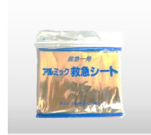
防寒用シート 価格:690円(税込)

緊急時の備えになります。コットン、ガーゼ、包帯、三角巾、ハサミ、油紙、絆創膏が入っています。