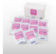
簡易トイレ(1個) 価格:390円(税込)

リチウム充電・手回し充電もできる多機能ラジオライトで携帯充電可能です。 サイズ 69×69×343mm