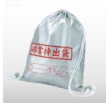
非常持出袋 (ナップザック式) 価格:1,460円(税込)

防災協会認定品 燃えにくい防災製品リュックです。 サイズ 400×405×70mm