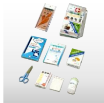
救急セット (ハンディバッグ付) 価格:1,660円(税込)

防災協会認定品 燃えにくい防災製品のナップザックです。 サイズ 465×390mm