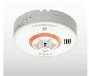
ねつたんちゃん(熱式)