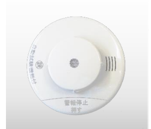
けむたんちゃん(煙式)