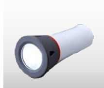
単3と単1が使える 防水ライト 価格:1,540円(税込)

LED と反射板の併用で明るさが増します。単 3 汎用電池×4(別売)サイズ 直径 119×180mm