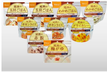
アルファ米セット (アルファ米9品)