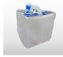
ウォータータンク 価格:980円(税込)

折り畳むと約半分の容量になる収納袋付ヘルメットです。 サイズ 303×220×82mm