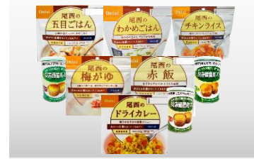
アルファ米とパンの缶詰セット (アルファ米6品とパンの缶詰3品)