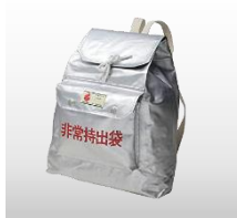
非常持出袋 (リュック式) 価格:3,400円(税込)

防災協会認定品 燃えにくい防災製品リュックです。 サイズ 400×405×70mm