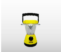
LED ランタンライト 価格:1,380円(税込)

金色面は外側に使用すると保温効果があり、銀色面は断熱効果があります。サイズ 125×225mm