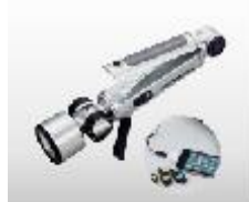
ラジオライト 価格:6,840円(税込)

完全防水で水深5mまで使用可能です。白色LED×1灯 サイズ 直径 65×130mm